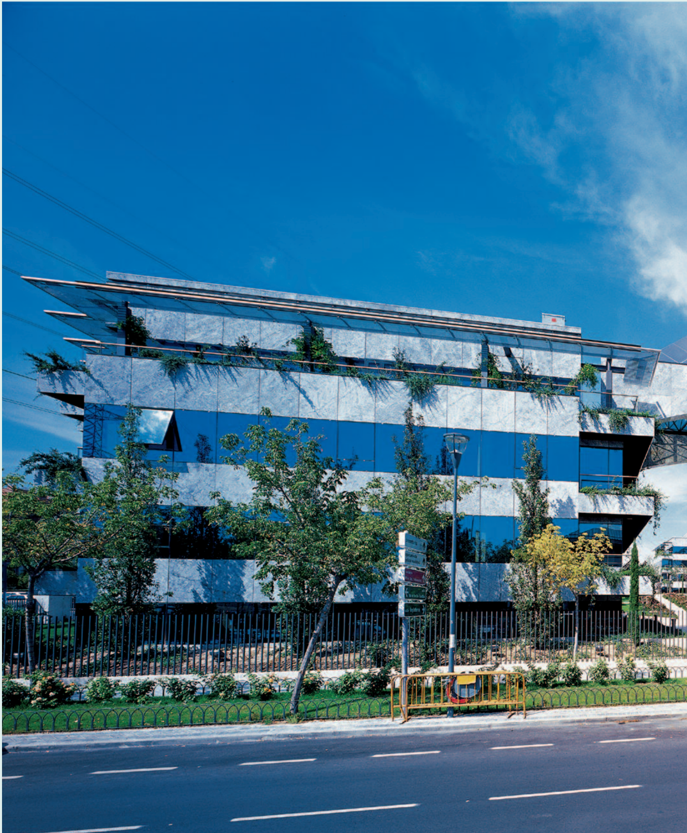
Parque Empresarial "Urbis Center" Pozuelo de Alarcón. Madrid